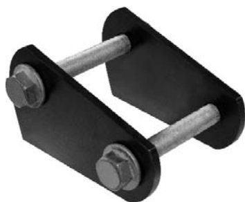
000.00 = JUMELO DA MOLA DIANT. P/ TRASEIRA DELIVERY 11.160 APÓS 2018 Nº. ORIG. (23B.411.127)