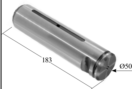
000.000 = PINO DA BALANÇA SUPORTE MOLA CENTRAL TRUCK ATEGO 3030 APÓS 2018