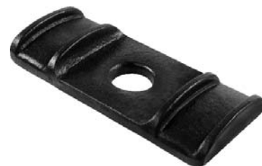
000.00 = GUIA DO GRAMPO