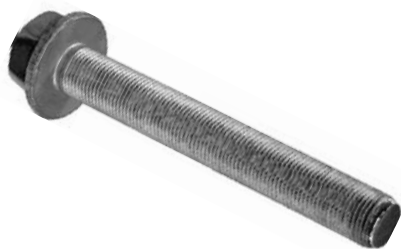
790.350 = PINO DO JUMELO DA MOLA DIANT. E TRAS. P/ TRAS. DELIVERY 11.160 APÓS 2018 (COMP. 147 MM) M18 X 1,5 N°. ORIG. ( )