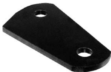
000.00 = CHAPA DE JUMELO DIANT. P/ TRAS. DELIVERY 11.160 APÓS 2018 Nº. ORIG. (23B.411.27)