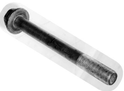
922.568 = PORCA SEXTAVADA AUTO TRAVANTE (M18 X 1,5) N°. ORIG. ( )