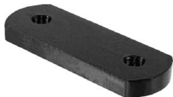
000.00 = CHAPA DE JUMELO TRAS. P/ TRAS. DELIVERY 11.160 APÓS 2018 Nº. ORIG. (23B.599.195)