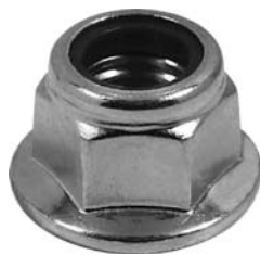
000.00 = PORCA SEXTAVADA AUTO TRAVANTE PINO JUMELO DELIVERY 11.160 APÓS 2018 (M18 X 1,5) N°. ORIG. ( )