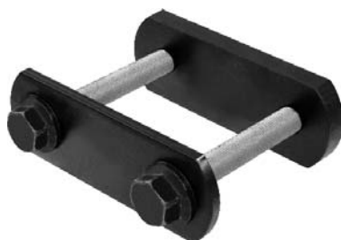
000.00 = JUMELO DA MOLA TRAS. P/ TRASEIRA DELIVERY 11.160 APÓS 2018 Nº. ORIG. (23B.599.195 / 23B.599.196)