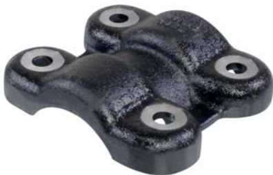
586.150 = SAPATA DE GRAMPO TRAS. C-10 / C-14 / C-15 / D-10 / D-20 Nº. ORIG. (7.317.209)