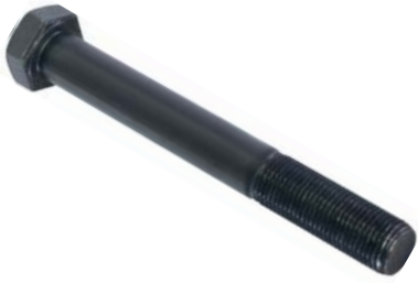
796.153 = PINO DA MOLA TRAS. D-20 APÓS 1995