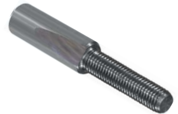
843.400 = TRAVA PINO DA MOLA TRASEIRA C-60 / D-70 (LONGA) Nº. ORIG. (7.326.855)