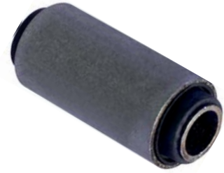
096.150 = BUCHA SILENCIOSA TRAS. C-10 / C-14 / D-10 / D-20 ATÉ 1991 (28,6 X 14,4) N°. ORIG. (7.317.426)