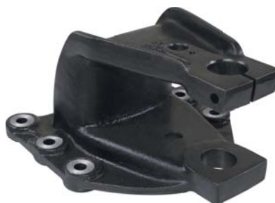
676.419 = SUPORTE DA MOLA TRAS. P/ DIANT. D-11000 A D-13000 N°. ORIG. (94.636.360)