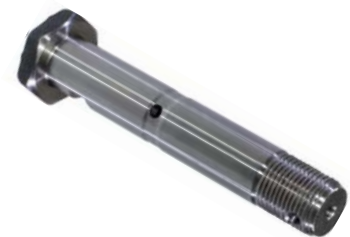
796.406 = PINO DA MOLA DIANT. P/ TRAS. D-60 / D-70 (ADAPT.) SUBST. 3.656.669 (ROSCA 7/8) N°. ORIG. (FAMA-656)