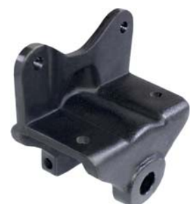
676.401 = SUPORTE DA MOLA DIANT. P/ TRAS. 6500 57/71 Nº. ORIG. (3.732.825)