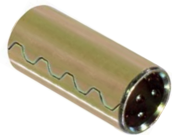
096.400 = BUCHA AÇO DIANT. BRASIL 57/71 (2" X 7/8 X 11/16) - BAL N°. ORIG. (7.352.502)