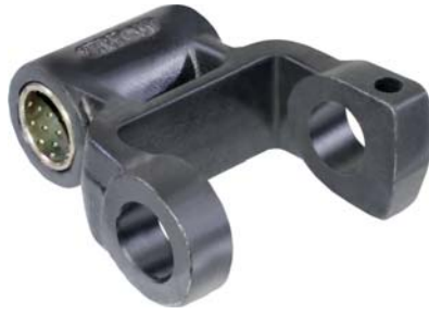
246.401 = ALGEMA DA MOLA TRASEIRA C-60 / D-60 / D-70 N° ORIG. (7.326.850)