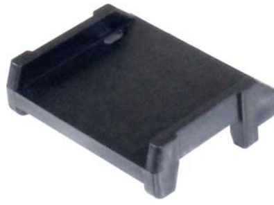
069.201 = APOIO DA MOLLA TRAS. S-10 NOVA (POLIPROPILENO)