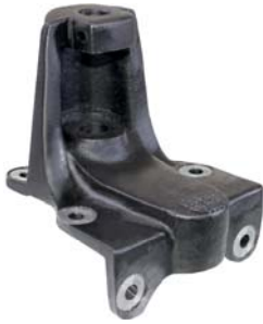
676.402 = SUPORTE DA MOLA TRAS. BRASIL 57/71 Nº. ORIG. (3.723.046)