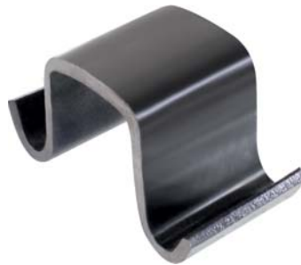
487.400 = GUIA GRAMPO DIANT. D-60 / DETROIT (AÇO ESTAMP.) Nº. ORIG. (7.326.782)