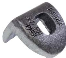
387.401 = CASTANHA DA RODA TRASEIRA D-60 / DETROIT N° ORIG. (7.326.820)