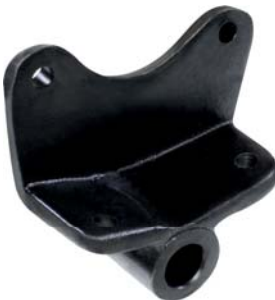
676.409 = SUPORTE DA MOLA DIANT. P/ DIANT. DETROIT ESQ. Nº. ORIG. (9.307.047)