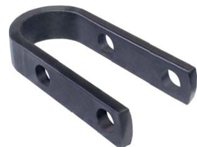
146.400 = CHAPA DE JUMELO TIPO "U" DIANT. D-60 / D-70 / DETROIT