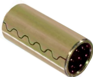
096.401 = BUCHA AÇO TRAS. BRASIL 57/71 E D-60 / D-70 DIANT. (2.1/2 X 1.1/8 X 7/8) - BAL N°. ORIG. (7.352.507)