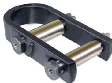
736.402 = JUMELO DA MOLA DIANT. TIPO "U" C-60 / D-70 / DETROIT 72/83 N°. ORIG. (FAMA-246)