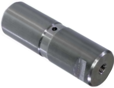
796.413 = PINO DA MOLA TRAS. (TENSOR) D-11000 A D-21000 Nº. ORIG. (94.636.396)