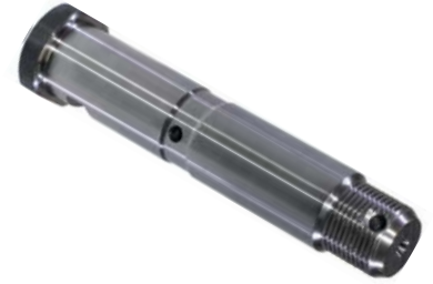
796.412 = PINO DA MOLA DIANT. P/ TRASEIRA D-11000 A D-21000 (ADAPT.) C/ CAB. E ROSCA 1"