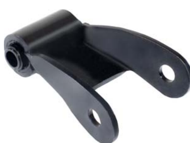
246.150 = ALGEMA DA MOLA TRASEIRA C-10 / D-10 (C/ BUCHA) Nº. ORIG. (7.317.429)