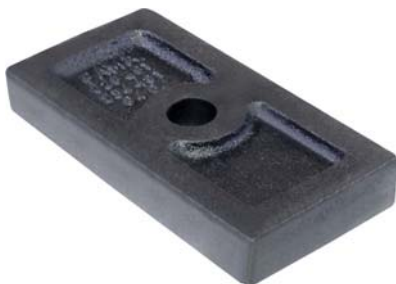
626.401 = SEPARADOR C/ FEIXE C-60 / D-60 / D-70