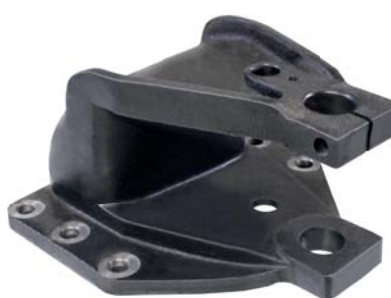
676.413 = SUPORTE DA MOLA TRAS. P/ DIANT. DETROIT ESQ. Nº. ORIG. (9.307.652)