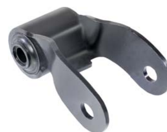
246.151 = ALGEMA DA MOLA TRASEIRA D-20 APÓS 1995 E D-40 (C/ BUCHA) Nº. ORIG. (94.642.383)