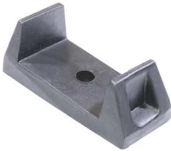
297.400 = ASSENTO FEIXE MOLA TRAS. 6500 (BRASIL) 57/71 N° ORIG. (7.317.258)