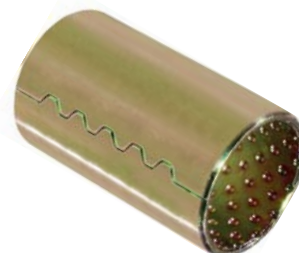
096.406 = BUCHA AÇO TRAS. (TENSOR) D-11000 A D-21000 (3" X 1.3/4 X 1.1/2) - BAL Nº. ORIG. (94.636.445)