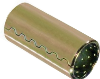
096.403 = BUCHA AÇO TRAS. D-60 / D-70 (3" X 1.3/8 X 1.1/8) - BAL N°. ORIG. (7.352.512)