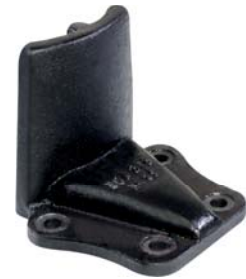
676.408 = SUPORTE DA MOLA AUX. C-60 / D-60 / D-70 / D-11000 Nº. ORIG. (7.326.849)