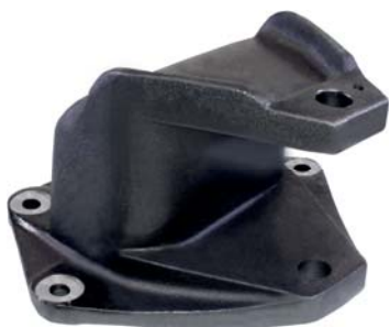
676.415 = SUPORTE DA MOLA TRAS. P/ TRAS. DETROIT ESQ. N°. ORIG. (9.307.654)