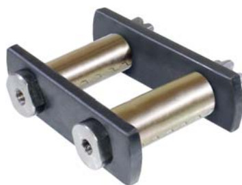
736.401 = JUMELO DA MOLA DIANT. C-60 / D-70 / DETROIT ORIGINAL 72/83 N°. ORIG. (7.326.246)