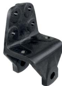
676.417 = SUPORTE DA MOLA DIANT. P/ DIANT. D-11000 A D-13000 N°. ORIG. (94.640.666)