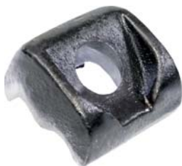
387.400 = CASTANHA DA RODA DIANTEIRA D-60 / DETROIT N° ORIG. (7.330.097 / 9.307.393)