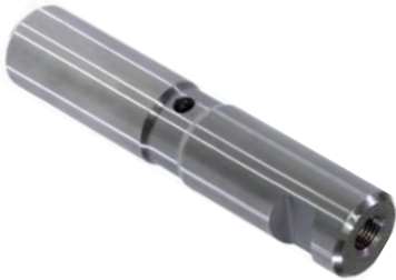
796.401 = PINO DA MOLA TRAS. BRASIL 57/71 E D-60 / D-70 DIANT. P/ TRAS. (COMP. 109,5 MM) N°. ORIG. (3.656.669-C)