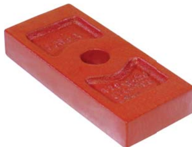
626.300 = SEPARADOR C/ FEIXE BRASIL 57/71