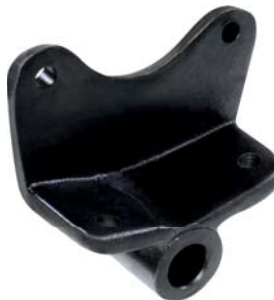
676.410 = SUPORTE DA MOLA DIANT. P/ DIANT. DETROIT DIR. Nº. ORIG. (9.307.048)