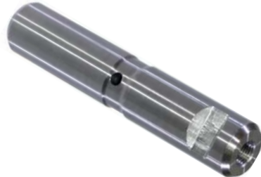
796.402 = PINO DA MOLA TRAS. BRASIL 57/71 E D-60 / D-70 DIANT. P/ TRAS. (COMP. 115 MM) N°. ORIG. (3.656.669-L)