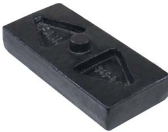
345.045 = CALÇO P/ LEVANTAR MOLEJO TRUCK (77 X 20 MM) ORIGINAL N° ORIG. (E8TH-5594-BA)