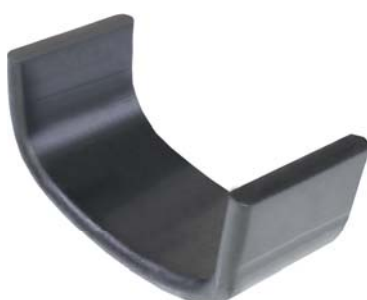
146.455 = CHAPA DO SUPORTE TRAS. P/ DIANT. E TRAS. P/ TRAS. DETROIT (BATENTE SUPERIOR)