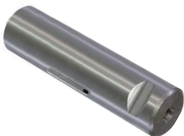
796.407 = PINO DA MOLA TRAS. (TENSOR) DETROIT N°. ORIG. (9.303.656)