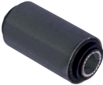
096.151 = BUCHA SILENCIOSA TRAS. D-20 91/94 (33 X 14,4) N°. ORIG. (52.259.152)