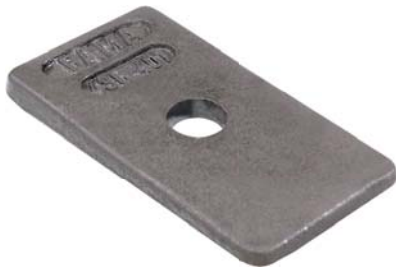
436.401 = CUNHA MOLA TRAS. C-60 / D-70