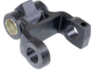
246.402 = ALGEMA DA MOLA DIANTEIRA D-11000 A D-13000 N° ORIG. (94.615.642)