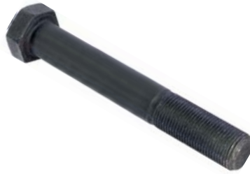
796.411 = PINO DA MOLA DIANT. P/ DIANT. D-11000 A D-21000 TIPO PARAF. (COMP. 153 MM) Nº. ORIG. (FAMA D-11000)