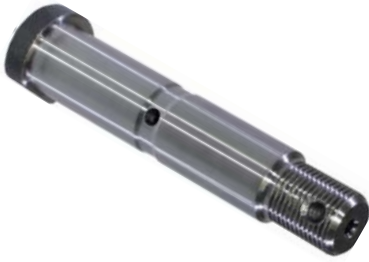
796.410 = PINO JUMELO TIPO "U" DIANT. C/ CAB. E ROSCA 3/4 Nº. ORIG. (FAMA-326)