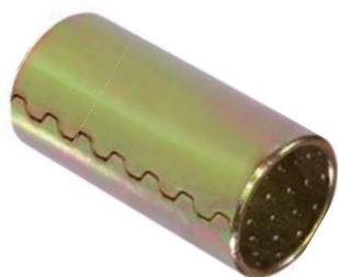
096.404 = BUCHA AÇO TRAS. (TENSOR) DETROIT (3" X 1.1/2 X 1.1/4) - BAL Nº. ORIG. (7.352.514)