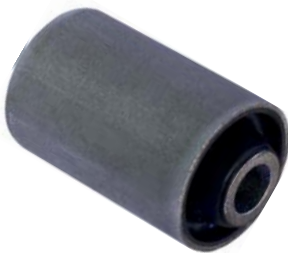
096.154 = BUCHA DA MOLLA TRAS. P/ TRAS. BLAZER / S-10 APÓS 1996 N°. ORIG. (93.392.236)