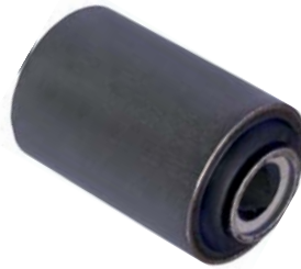
096.152 = BUCHA SILENCIOSA TRAS. D-20 APÓS 1995 E D-40 (44 X 15,9) N°. ORIG. (93.204.488)