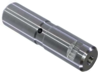
796.404 = PINO DA MOLA TRAS. D-60 / D-70 E D-11000 DIANT. P/ TRAS. (COMP. 116 MM) N°. ORIG. (7.326.856-C)