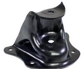
676.151 = SUPORTE DA MOLA TRAS. P/ DIANT. C-10 DIREITO Nº. ORIG. (2.443.462)