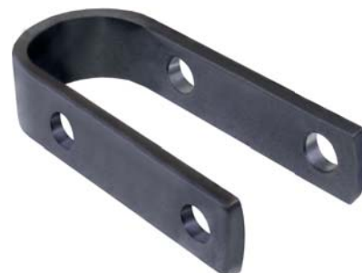
146.397 = CHAPA DE JUMELO BRASIL TIPO "U" 57/71