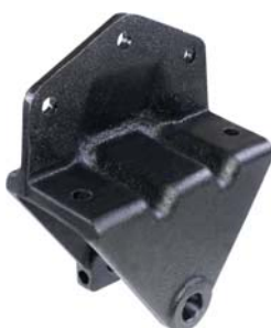
676.412 = SUPORTE DA MOLA DIANT. P/ TRAS. DETROIT DIR. Nº. ORIG. (9.307.078)