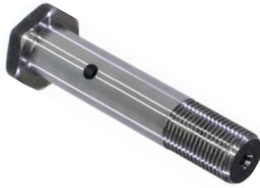
796.400 = PINO DA MOLA DIANT. P/ TRAS. BRASIL 57/71 (11/16) N°. ORIG. (3.713.064)