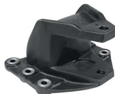
676.420 = SUPORTE DA MOLA TRAS. P/ TRAS. D-11000 A D-13000 N°. ORIG. (94.636.361)