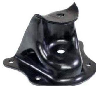
676.150 = SUPORTE DA MOLA TRAS. P/ DIANT. C-10 ESQUERDO Nº. ORIG. (2.443.463)