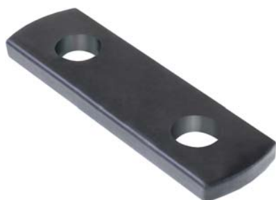
146.398 = CHAPA DE JUMELO D-60 ORIG. (FURO OVAL) 72/81