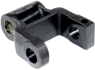
246.400 = ALGEMA DA MOLA TRASEIRA BRASIL 6500 57/71 N° ORIG. (3.725.531)