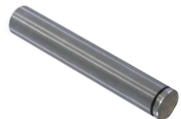
796.409 = PINO DA MOLA TRAS. D-60 / D-70 / D-11000 A D-21000 (RESSALTO) N°. ORIG. (9.304.954)