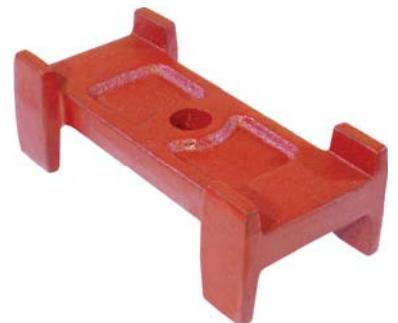
626.301 = SEPARADOR C/ FEIXE BRASIL C/ GUIAS 57/71