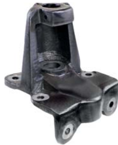
676.407 = SUPORTE DA MOLA TRAS. D-70 (CHASSI REFORÇADO) Nº. ORIG. (7.325.427)