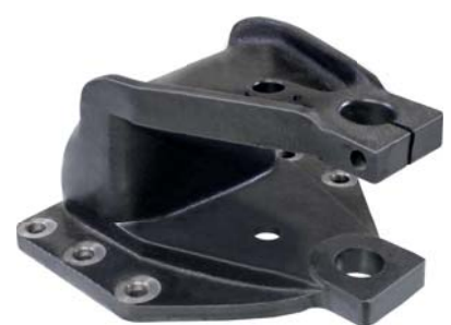
676.414 = SUPORTE DA MOLA TRAS. P/ DIANT. DETROIT DIR. Nº. ORIG. (9.307.653)