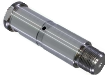
796.414 = PINO DA MOLA TRAS. (TENSOR) D-11000 A D-21000 (ADAPT.) SUBST. 94.636.396 Nº. ORIG. (FAMA-636)