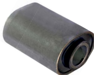
096.405 = BUCHA SILENCIOSA DIANT. P/ DIANT. OVAL D-11000 A D-21000 (OVAL X INT. 7/8) Nº. ORIG. (94.651.655)