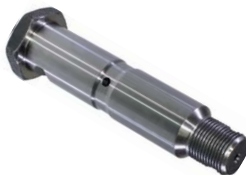
796.408 = PINO DA MOLA TRAS. (TENSOR) DETROIT C/ CAB E ROSCA 1" SUBST. 9.303.656 N°. ORIG. (FAMA-303)