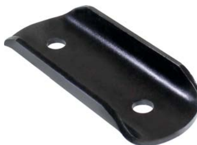
146.150 = CHAPA DE JUMELO TRASEIRA S-10 Nº. ORIG. (93.223.948)