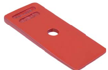
436.400 = CUNHA MOLA DIANT. C-60 / D-70 (ESPECIAL)