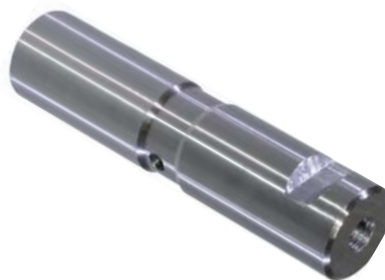
796.405 = PINO DA MOLA TRAS. D-60 / D-70 (COMP. 122 MM) N°. ORIG. (7.326.856-L)