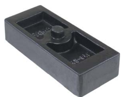
345.046 = CALÇO P/ LEVANTAR MOLEJO TRUCK (77 X 40 MM)