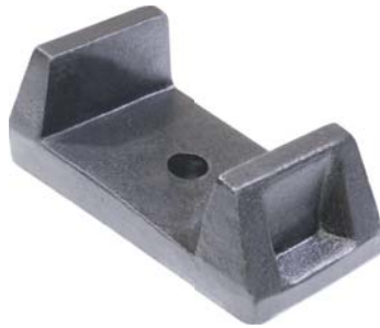
297.401 = ASSENTO FEIXE MOLA TRAS. C-60 / D-60 N° ORIG. (9.333.086)