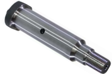
796.403 = PINO DA MOLA DIANT. P/ DIANT. D-60 / D-70 / DETROIT N°. ORIG. (7.326.776)