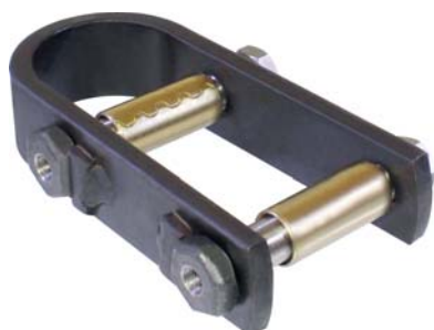
736.400 = JUMELO DA MOLA DIANT. BRASIL TIPO "U" 57/71 N°. ORIG. (3.741.086)