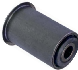
096.160 = BUCHA DA MOLLA TRAS. P/ DIANT. BLAZER / S-10 APÓS 1996 N°. ORIG. (15.529.515)