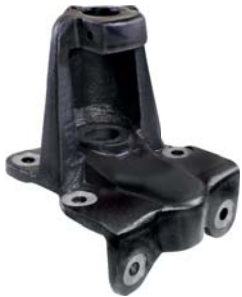
676.406 = SUPORTE DA MOLA TRAS. C-60 / D-60 Nº. ORIG. (7.329.242)