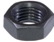
922.001 = PORCA 11/16 P/ PINO DIANT. P/ TRAS. BRASIL 57/71 N°. ORIG. (593.992)