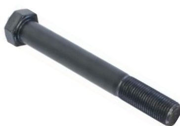
796.151 = PINO DA MOLA TRAS. C-10 / C-14 / D-10 P/ BE (COMP. 4.1/2") N°. ORIG. (455.101-L)