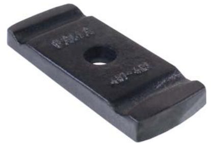
487.401 = GUIA GRAMPO TRAS. D-60 / DETROIT (FUNDIDO) Nº. ORIG. (7.326.088)