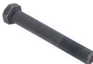
796.152 = PINO DA MOLA TRAS. D-20 91/94 P/ BE (COMP. 4.1/2") N°. ORIG. (93.204.486)