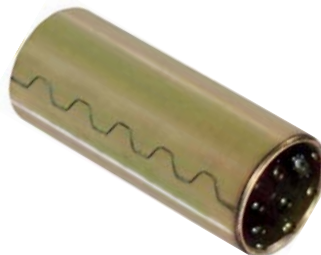
096.402 = BUCHA AÇO ALGEMA TRAS. BRASIL 57/71 (2.1/2 X 1" X 7/8) - BAL N°. ORIG. (594.664-D)