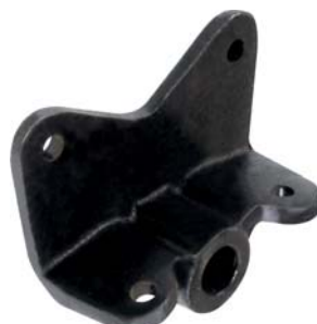
676.400 = SUPORTE DA MOLA DIANT. P/ DIANT. 6500 57/71 Nº. ORIG. (3.742.256)