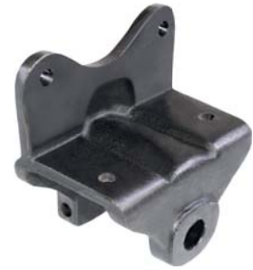
676.405 = SUPORTE DA MOLA DIANT. P/ TRAS. C-60 / D-70 Nº. ORIG. (7.333.083)