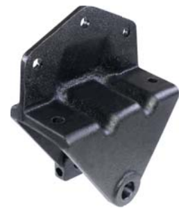
676.411 = SUPORTE DA MOLA DIANT. P/ TRAS. DETROIT ESQ. Nº. ORIG. (9.307.077)