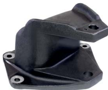
676.416 = SUPORTE DA MOLA TRAS. P/ TRAS. DETROIT DIR. N°. ORIG. (9.307.655)