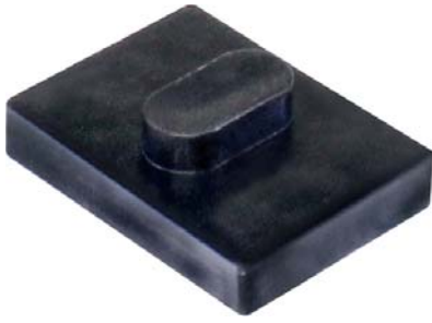
069.200 = APOIO DA MOLLA TRAS. S-10 NOVA (NYLON) C/ CERA