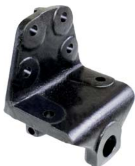
676.418 = SUPORTE DA MOLA DIANT. P/ TRAS. D-11000 A D-13000 N°. ORIG. (94.640.667)