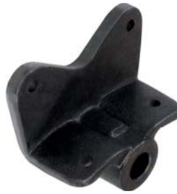
676.404 = SUPORTE DA MOLA DIANT. P/ DIANT. C-60 / D-70 Nº. ORIG. (7.333.081)