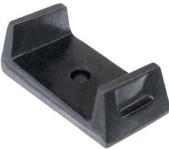
297.403 = ASSENTO FEIXE MOLA TRAS. DETROIT N° ORIG. (9.304.329)