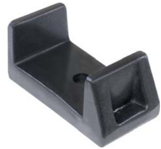
297.402 = ASSENTO FEIXE MOLA TRAS. D-70 N° ORIG. (7.326.806)