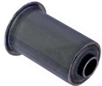
096.153 = BUCHA SILENCIOSA S-10 N°. ORIG. (14.027.938)