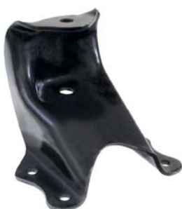
676.152 = SUPORTE DA MOLA TRAS. P/ TRAS. C-10 Nº. ORIG. (2.443.466)