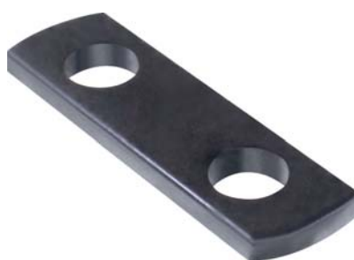
146.399 = CHAPA DE JUMELO D-60 ORIG. (FURO REDONDO) 72/81