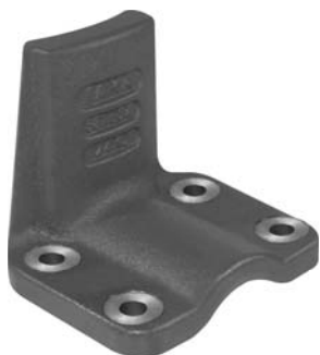
681.604 = SUPORTE DA MOLA AUXILIAR IVECO 160 E21 N° ORIG. (9841.3967)