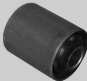
102.630 = BUCHA DA MOLA DIANT. IVECO TECTOR APÓS 2009 Nº. ORIG. (580.130.76.51)