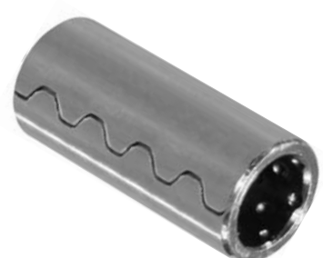
102.550 = BUCHA AÇO AUXILIAR TRATOR AD-7 / 7B / 70CI