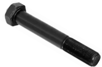
802.602 = PINO DO JUMELO TRAS. IVECO 160 E21