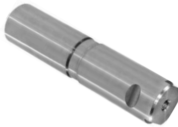
802.502 = PINO DA MOLA DIANT. 210 (COMP. 153 MM) Nº. ORIG. (1.735.45.044)