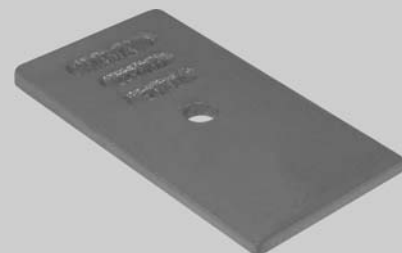
442.700 = CUNHA DA MOLA DIANT. IVECO EUROTECH (90 X 9 X 170 MM)