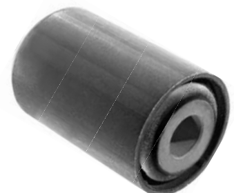
102.750 = BUCHA DA MOLA DIANT. IVECO STRALIS (TODOS) Nº. ORIG. (580.133.02.33)