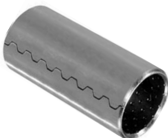
102.500 = BUCHA AÇO DIANT. 180 / 210 (90 X 42 X 35) - BAL Nº. ORIG. (1.735.45.017)