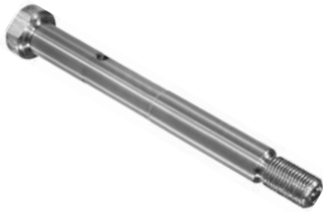
802.303 = PINO DA MOLA TRAS. 70 / 80 (LONGO) Nº. ORIG. (8.547.238-L)