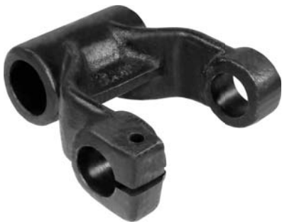
251.500 = ALGEMA DA MOLA TRASEIRA 190 / 210