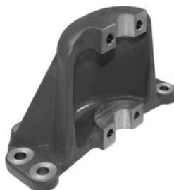
681.702 = SUPORTE DA MOLA TRAS. P/ DIANTEIRA IVECO EUROTECH 450 N° ORIG. (816.6856)