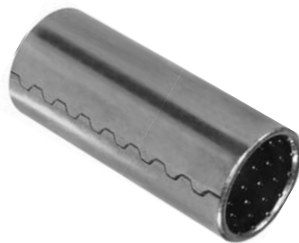
102.501 = BUCHA AÇO TRAS. 180 / 210 (4" X 42 X 35) - BAL Nº. ORIG. (1.701.48.002)