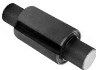
102.702 = BUCHA DA MOLA TRAS. P/ DIANTEIRA IVECO EUROTECH 450 C/ PINO