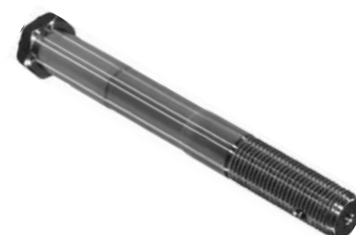
802.302 = PINO DA MOLA DIANT. E TRAS. P/ TRAS. 70 / 80 (CURTO) N° ORIG. (8.542.610-C)