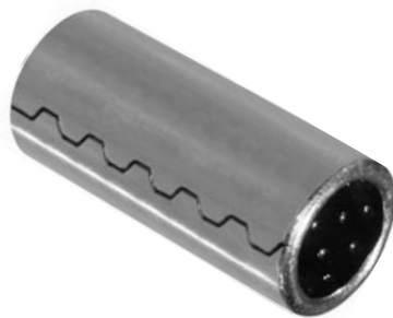
102.400 = BUCHA AÇO DIANT. 130 (69 X 29 X 22) - BAL