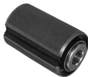
102.703 = BUCHA DO JUMELO TRAS. P/ TRASEIRA IVECO EUROTECH 450 Nº. ORIG. (7.143.407)