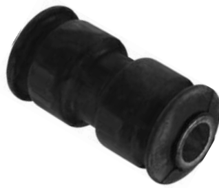
102.251 = BUCHA DA MOLA TRAS. P/ TRASEIRA STRADA Nº. ORIG. (46.473.041)