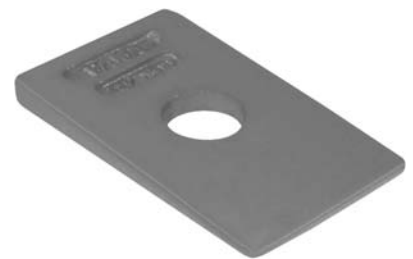
442.500 = CUNHA DA MOLA DIANT. 190 / 210 Nº. ORIG. (1.701/45008)