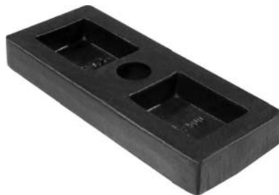
630.500 = SEPARADOR C/ FEIXE CAVALO (ESPECIAL)