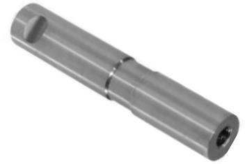
802.402 = PINO DA MOLA TRAS. 130 / 140 Nº. ORIG. (4.517.219)