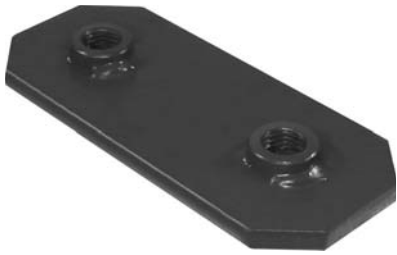
151.602 = CHAPA DE JUMELO TRAS. IVECO 160 E21 (INTERNA) C/ ROSCA