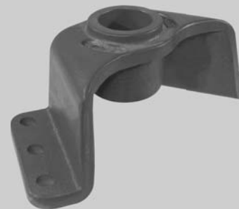
681.603 = SUPORTE DA MOLA TRAS. P/ TRAS. IVECO 160 E21 / 170 E22