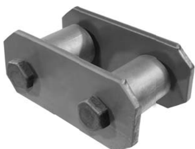
741.602 = JUMELO DA MOLA TRAS. IVECO 160 E21 (COMPLETO)