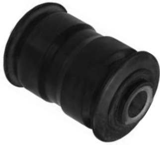
102.579 = BUCHA DA MOLA TRAS. P/ DIANTEIRA DUCATO