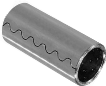
102.300 = BUCHA AÇO DIANT. E TRAS. 70 / 80 (69 X 30 X 24) - BAL