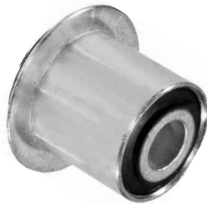
102.580 = BUCHA DA MOLA TRAS. P/ TRASEIRA DUCATO