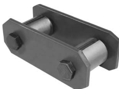
741.702 = JUMELO DA MOLA TRAS. IVECO EUROTECH 450 (COMPLETO)