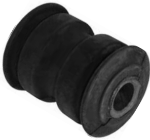
102.250 = BUCHA DA MOLA TRAS. P/ DIANTEIRA STRADA Nº. ORIG. (7.663.245)