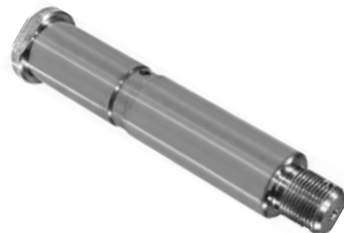
802.505 = PINO DA MOLA TRAS. (TENSOR) 210 C/ CAB. E ROSCA 1" (COMP. 160 MM) SUBST. 1.735.48.031 Nº. ORIG. (FAMA 48.031)