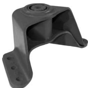
681.704 = SUPORTE DA MOLA TRAS. P/ TRASEIRA IVECO EUROTECH 450