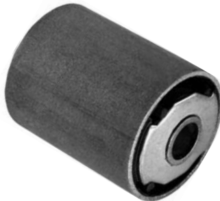
102.269 = BUCHA DA MOLA TRAS. P/ DIANTEIRA DOBLO