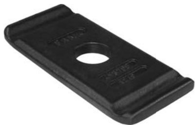
493.705 = GUIA DO GRAMPO TRAS. IVECO EUROTECH 450