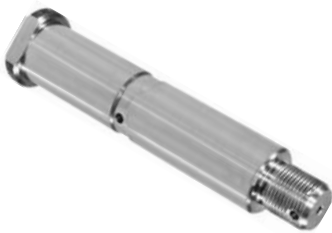
802.504 = PINO DA MOLA TRAS. (TENSOR) 210 C/ CAB. E ROSCA 1" (COMP. 153 MM) Nº. ORIG. (9.725.48.035)