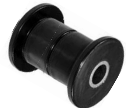
102.591 = BUCHA DA MOLA TRAS. IVECO DAILY 35S10 A 35S14 / 45S14 / 45C16 / 55C16 / 70C16 (POLIURETANO) Nº. ORIG. (9380.8935)