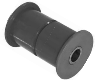
102.581 = BUCHA DA MOLA TRAS. P/ DIANTEIRA DUCATO (POLIURETANO)