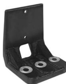
681.705 = SUPORTE DA MOLA AUXILIAR IVECO EUROTECH 450 P/ TRASEIRA N° ORIG. (4100.6235)