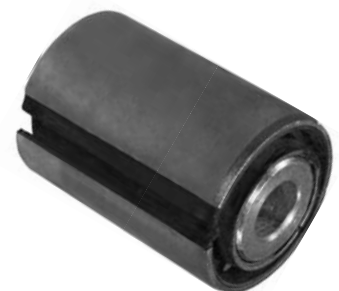
102.650 = BUCHA DA MOLA DIANT. CAMINHÃO IVECO