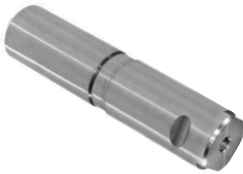
802.501 = PINO DA MOLA TRAS. 210 (COMP. 160 MM) Nº. ORIG. (1.735.48.032)