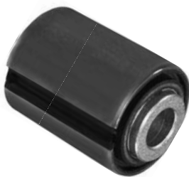
102.602 = BUCHA DA MOLA E DO JUMELO TRAS. IVECO 160 E21 Nº. ORIG. (98.413.939)