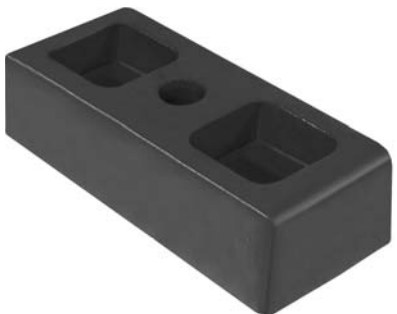
352.602 = CALÇO P/ LEVANTAR MOLEJO IVECO 160 E21