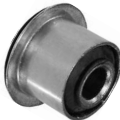
102.590 = BUCHA DA MOLA TRAS. DAILY 35S10 A 35S14 / 45S14 / 45C16 / 55C16 / 70C16 Nº. ORIG. (9380.8935)