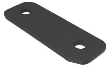
151.702 = CHAPA DE JUMELO TRAS. IVECO EUROTECH 450