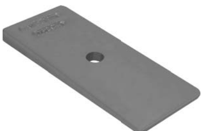
442.501 = CUNHA DA MOLA TRAS. 190 / 210