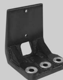
681.706 = SUPORTE DA MOLA AUXILIAR IVECO EUROTECH 450 P/ DIANTEIRA N° ORIG. (4100.6236)