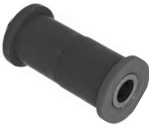
102.253 = BUCHA DA MOLA TRAS. P/ TRASEIRA STRADA (POLIURETANO)