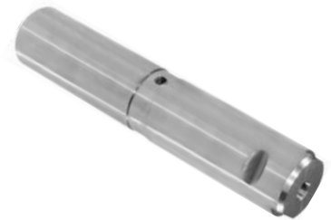
802.503 = PINO DA MOLA TRAS. 210 (COMP. 180 MM) Nº. ORIG. (1.735.48.031)