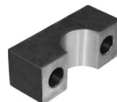
681.703 = MANCAL DO SUPORTE TRAS. P/ DIANTEIRA IVECO EUROTECH 450