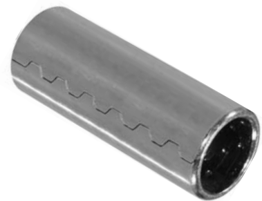
102.401 = BUCHA AÇO TRAS. 130 (79 X 30 X 24) - BAL