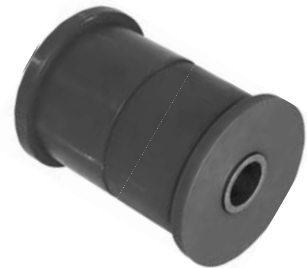
102.270 = BUCHA DA MOLA TRAS. P/ DIANTEIRA DOBLO (POLIURETANO)