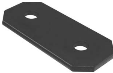
151.603 = CHAPA DE JUMELO TRAS. IVECO 160 E21 (EXTERNA)