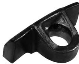
393.500 = CASTANHA DA RODA TRAS. 180 / 210 Nº. ORIG. (1.707.32.003)