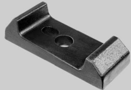
302.608 = ASSENTO FX. MOLA TRAS. IVECO TECTOR 240 / 160 E21 / 170 E22