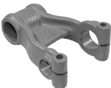
260.503 = ALGEMA DA MOLA TRAS. 112 A 142 / SÉRIE 4-360 Nº. ORIG. (363.770)