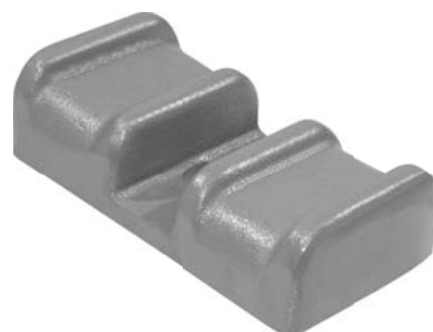
503.551 = GUIA GRAMPO TRAS. TRAÇADA BIDIRECIONAL 2º EIXO