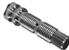
812.502 = PINO ROSCADO TRAS. 112 A 142 / TRAS. P/ TRAS. SÉRIE 4 (MOLA PLANA) Nº. ORIG. (135.035 / 355.147) 812.503 = IDEM CEMENTADO