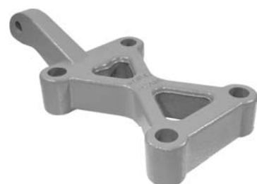
600.520 = SAPATA DO ESTABILIZ. TRAS. P-94 / 114 / 124 TRUCK ORIG. ESQUERDO Nº. ORIG. (1.377.419)