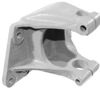
690.505 = SUPORTE MOLA DIANT. P/ DIANT. P-94 / 114G / 124G / 124R Nº. ORIG. (1.325.808)