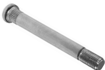
812.700 = PINO MOLA (TENSOR) SUECO Nº. ORIG. (1.394.816)