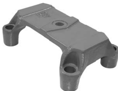
600.500 = SAPATA GRAMPO TRAS. 113 (4 X 2) Nº. ORIG. (1.377.206)