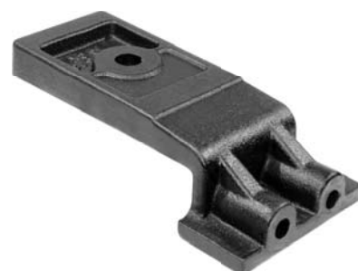
690.516 = SUPORTE ESTABILIZ. DIANT. 124 DIREITO Nº. ORIG. (1.428.597)