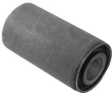
112.700 = BUCHA DA MOLA (TENSOR) SUECO