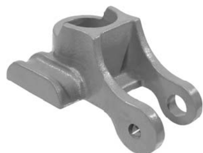
503.550 = GUIA GRAMPO DIANT. TRAÇADA BIDIRECIONAL 2º EIXO Nº. ORIG. (1.322.339)