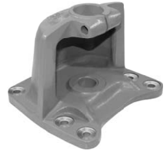
690.503 = SUPORTE MOLA TRAS. 112 A 142 (ESPECIAL) Nº. ORIG. (283.642)