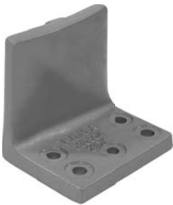
690.504 = SUPORTE MOLA AUX. 112 A 142 (5 FUROS) Nº. ORIG. (293.273)