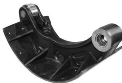
960.500 = PATIM DO FREIO DIANTEIRO 112 / 113 ANO 1995 Nº. ORIG. (4113)