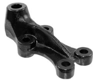
690.704 = SUPORTE AMORTEC. TRASEIRO 124 SERIE 4 SUSP. PNEUMÁTICA Nº. ORIG. (1.400.484)