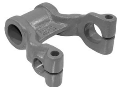
260.501 = ALGEMA DA MOLA DIANT. 112 A 142 / SÉRIE 4-360 Nº. ORIG. (275.568)