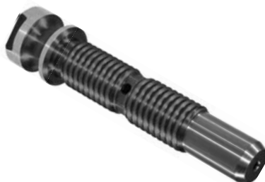
812.500 = PINO ROSCADO DIANT. (TODOS) Nº. ORIG. (128.681 / 355.145) 812.501 = IDEM CEMENTADO