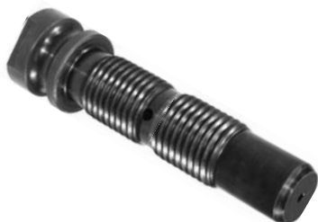
812.505 = PINO ROSCADO TRAS. 140 (COMP. 4") CEMENTADO Nº. ORIG. (135.697)