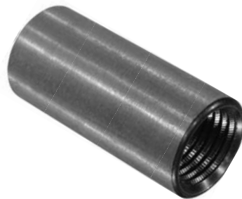
112.505 = BUCHA ROSQ. TRAS. LK-140 (100 MM) CEMENTADA Nº. ORIG. (135.698)