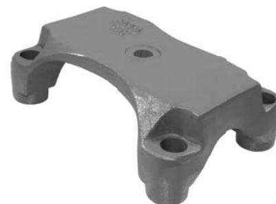
600.501 = SAPATA GRAMPO TRAS. 113 (6 X 2) Nº. ORIG. (1.377.208)