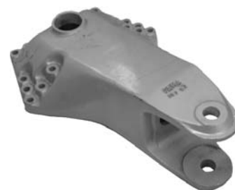
690.512 = SUPORTE MOLA TRAS. P/ TRAS. E DIANT. P-94 / 114 / 124 TRUCK ORIGINAL Nº. ORIG. (1.377.745)