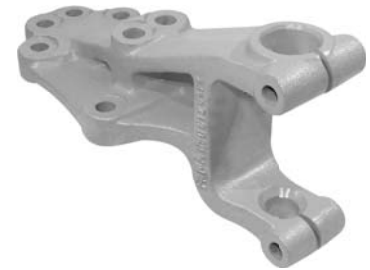
690.612 = SUPORTE MOLA DIANT. P/ TRAS. TRAÇ. BIDIRECIONAL 2º EIXO Nº. ORIG. (1.335.893)