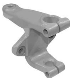
690.514 = SUPORTE MOLA DIANT. P/ TRAS. P-94 / 114G / 124G / 124R APÓS 2006 Nº. ORIG. (1.739.455)