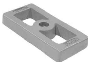
640.500 = SEPARADOR C/ FEIXE 110 A 142 640.501 = SEPARADOR C/ FEIXE 113 (25 MM) Nº. ORIG. (285.389)