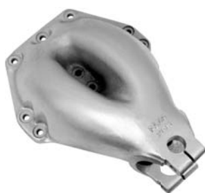
690.511 = SUPORTE MOLA TRAS. CAVALO MECÂNICO (6 X 2) Nº. ORIG. (202.335)