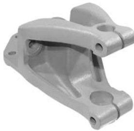
690.611 = SUPORTE MOLA DIANT. P/ DIANT. TRAÇ. BIDIRECIONAL 2º EIXO DIR. Nº. ORIG. (1.335.901)