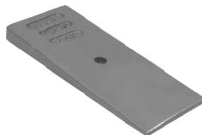
452.504 = CUNHA MOLA TRAS. 112 A 142 (90 X 16 X 220 MM) (FURO 16 MM) ESPECIAL