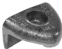
403.501 = CASTANHA DA RODA TRAS. 112 A 142 Nº. ORIG. (523.887)