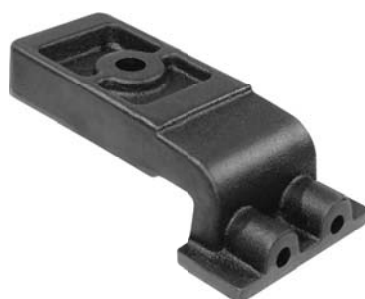
690.515 = SUPORTE ESTABILIZ. DIANT. 124 ESQUERDO Nº. ORIG. (1.333.683)