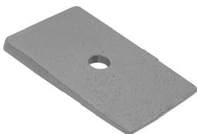
452.500 = CUNHA MOLA DIANT. 112 A 142