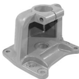
690.508 = SUPORTE MOLA TRAS. 360 (MOLA PARAB.) E TRAS. P/ DIANT. SÉRIE 4 (MOLA PLANA) Nº. ORIG. (1.377.779)