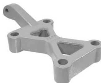
600.521 = SAPATA DO ESTABILIZ. TRAS. P-94 / 114 / 124 TRUCK ORIG. DIREITO Nº. ORIG. (1.377.420)