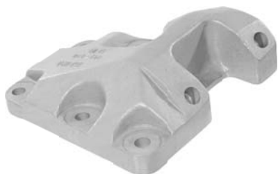
690.850 = SUPORTE DO BRAÇO TENSOR ÔNIBUS Nº. ORIG. (424.633-B)