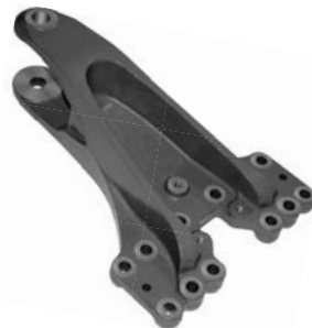
690.700 = SUPORTE MOLA TRAS. CAMINHÃO GR4 2010 / 2011 SUSPENSÃO A AR Nº. ORIG. (1.798.578)