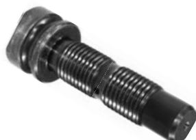
812.507 = PINO ROSCADO TRAS. 340 E 360 (MOLA PARAB.) TRAS. P/ DIANT. SÉRIE 4 (M. PLANA) CEMENTADO Nº. ORIG. (355.148)