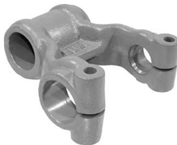
260.499 = ALGEMA DA MOLA TRAS. 110 / 111 Nº. ORIG. (138.640)