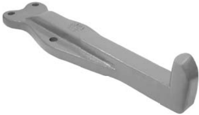
690.600 = SUPORTE MOLA TRUCK TRAÇADO LATERAL P/ DIANT. Nº. ORIG. (343.401) 690.601 = IDEM P/ TRASEIRA Nº. ORIG. (327.354-B)