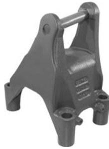
690.604 = SUPORTE MOLA TRAS. 142 / 310 TRAÇADO ESQUERDO Nº. ORIG. (1.426.442)