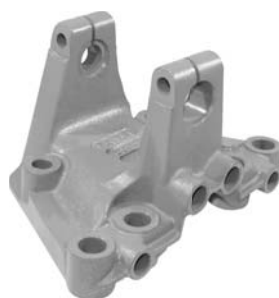
690.519 = SUPORTE MOLA DIANT. P/ DIANT. 124 APÓS 2011 DIR. Nº. ORIG. (1.785.815)