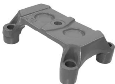
600.510 = SAPATA GRAMPO TRAS. SERIE 4-360