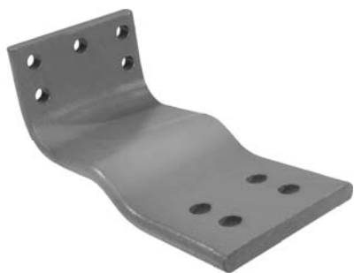
690.510 = SUPORTE PARALAMA P/ DIANT. SÉRIE 4-360 (AÇO)