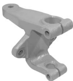
690.507 = SUPORTE MOLA DIANT. P/ TRAS. P-94 / 114G / 124G / 124R DIREITO Nº. ORIG. (1.326.548)