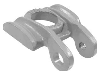
503.502 = GUIA GRAMPO DIANT. 112 A 142 C/ GARRA P/ AMORTEC.