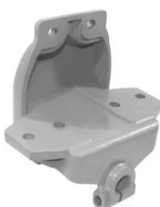
690.495 = SUPORTE MOLA DIANT. P/ DIANT. 110 / 111 Nº. ORIG. (157.430)