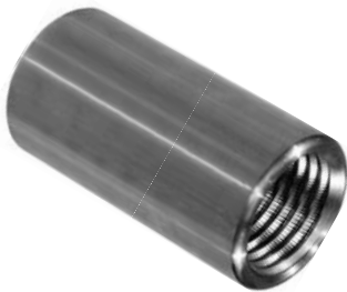
112.502 = BUCHA ROSQ. TRAS. TODOS (90 MM) Nº. ORIG. (135.036) 112.503 = IDEM CEMENTADA