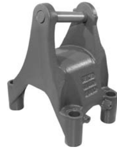
690.605 = SUPORTE MOLA TRAS. 142 / 310 TRAÇADO DIREITO Nº. ORIG. (1.426.444)