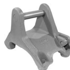
690.560 = SUPORTE MOLA TRAS. 124C / 360 ESQUERDO (DESLIZ.) Nº. ORIG. (1.395.047) 690.561 = IDEM DIREITO Nº. ORIG. (1.395.048)