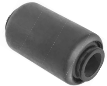
112.520 = BUCHA DA MOLA TRAS. P94 / P114 / P124 / P164 Nº. ORIG. (1.362.710)