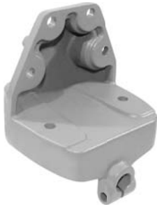
690.501 = SUPORTE MOLA DIANT. 112 A 142 Nº. ORIG. (275.460)