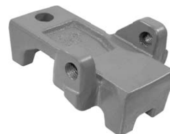
600.522 = SAPATA DO MOLEJO PARABÓLICO TRAS. P-94 / 114 / 124 TRUCK ORIGINAL Nº. ORIG. (1.383.644)