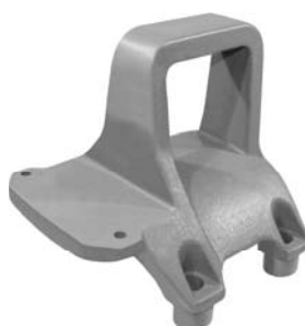
690.550 = SUPORTE DA MOLA 112 / 113 / 142 / 143 (DESLIZANTE) Nº. ORIG. (364.627)