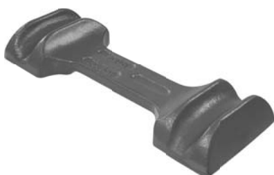
503.510 = GUIA GRAMPO TRAS. SÉRIE 4 SUSP. A AR APÓS 2000 Nº. ORIG. (362.384)