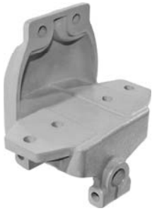
690.497 = SUPORTE MOLA DIANT. P/ TRAS. 110 / 111 DIREITO Nº. ORIG. (172.760)