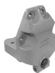
690.845 = SUPORTE MOLA DIANT. P/ TRAS. ÔNIBUS ESQUERDO Nº. ORIG. (427.434) 690.846 = IDEM DIREITO Nº. ORIG. (428.434)