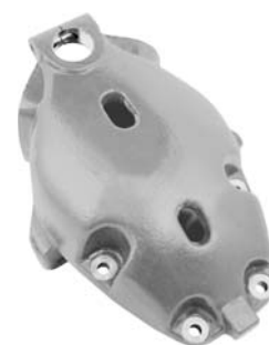
690.520 = SUPORTE MOLA TRAS. P/ DIANT. ÔNIBUS KS-112 / S-113 Nº. ORIG. (413.746)