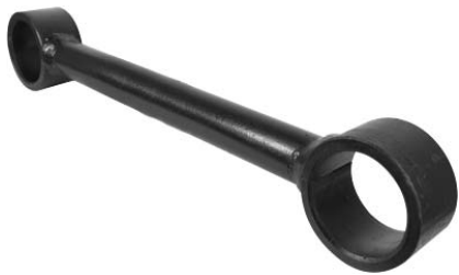
035.520 = BARRA REAÇÃO SUP. P94 / P114 / P124 / P164 TRAÇADA (570 MM) Nº. ORIG. (1.326.775)