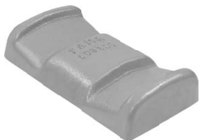
503.600 = GUIA GRAMPO TRAS. TRAÇADA (100 MM) LARGO