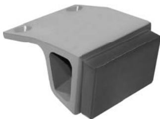
690.615 = SUPORTE BATEDOR EIXO TRAS. TRAÇ. BIDIRECIONAL Nº. ORIG. (1.370.141)