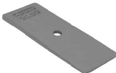
452.501 = CUNHA MOLA TRAS. 112 A 142 (FURO 5/8) 452.502 = IDEM (FURO 1/2) 452.503 = IDEM (FURO 9/16)