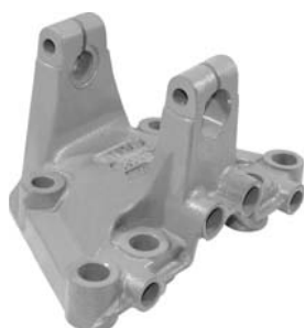
690.518 = SUPORTE MOLA DIANT. P/ DIANT. 124 APÓS 2011 ESQ. Nº. ORIG. (1.785.814)