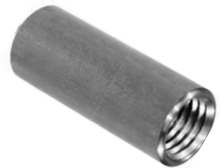
112.500 = BUCHA ROSQ. DIANT. TODOS (90 MM) Nº. ORIG. (128.680) 112.501 = IDEM CEMENTADA