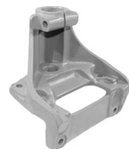
690.509 = SUPORTE MOLA TRAS. P/ TRAS. SÉRIE 4-360 (M. PLANA) Nº. ORIG. (1.377.780)