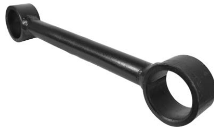
035.521 = BARRA REAÇÃO INF. P94 / P114 / P124 / P164 TRAÇADA (620 MM) Nº. ORIG. (1.399.180)