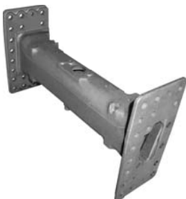
690.705 = TRAVESSA CHASSIS CAMINHÃO GR4 2010 / 2011 SUSPENSÃO A AR Nº. ORIG. (1.798.014)