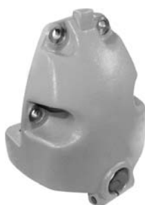
690.521 = SUPORTE MOLA TRAS. P/ TRAS. ÔNIBUS KS-112 / S-113 Nº. ORIG. (406.738)