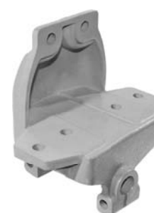
690.496 = SUPORTE MOLA DIANT. P/ TRAS. 110 / 111 ESQUERDO Nº. ORIG. (172.759)