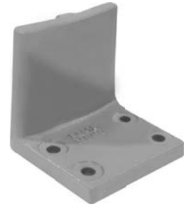
690.499 = SUPORTE MOLA AUX. 110 (4 FUROS) Nº. ORIG. (167.079)