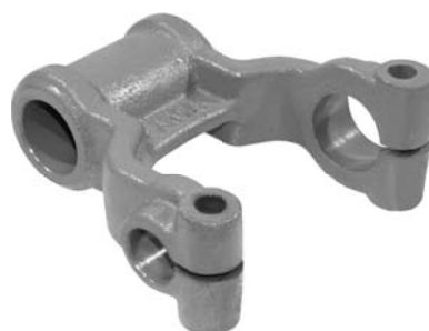
260.510 = ALGEMA DA MOLA DIANT. ÔNIBUS 113 / 143 (LONGA) Nº. ORIG. (275.568)