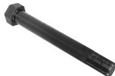
812.512 = PINO SUPORTE TRAS. P-94 / 114 / 124 TRUCK ORIGINAL (COMP. 240 MM)