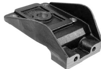
600.519 = SAPATA DO ESTABILIZ. DIANT. 124 Nº. ORIG. (365.761)