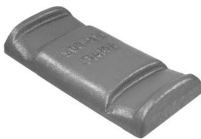
503.501 = GUIA GRAMPO TRAS. 110 A 142 Nº. ORIG. (135.708)