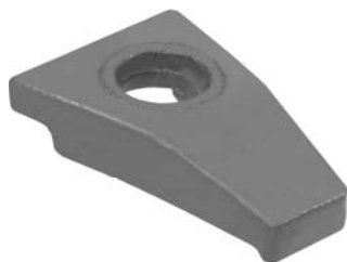
403.500 = CASTANHA DA RODA DIANT. 112 A 142 Nº. ORIG. (347.048)