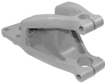
690.610 = SUPORTE MOLA DIANT. P/ DIANT. TRAÇ. BIDIRECIONAL 2º EIXO ESQ. Nº. ORIG. (1.335.902)