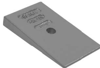
452.499 = CUNHA MOLA DIANT. 110 A 142 (ESPESSURA 20 MM)