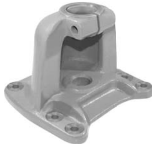
690.498 = SUPORTE MOLA TRAS. B-75 / L-75 / L-76 / 100 / 110 ATÉ 1982 Nº. ORIG. (134.223)