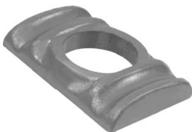
503.500 = GUIA GRAMPO DIANT. 110 / 111 Nº. ORIG. (275.301)