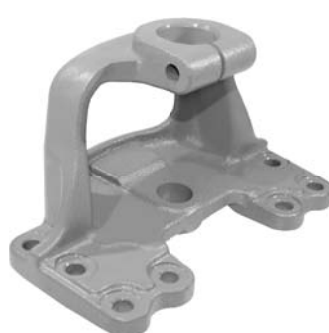
690.720 = SUPORTE MOLA TRAS. P/ DIANT. E TRAS. G5 (MOLA 4")