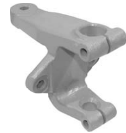
690.506 = SUPORTE MOLA DIANT. P/ TRAS. P-94 / 114G / 124G / 124R ESQUERDO Nº. ORIG. (1.326.547)