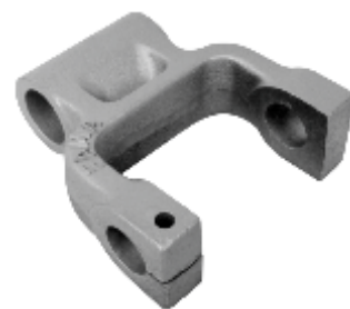
270.151 = ALGEMA DA MOLA ÔNIBUS CUMMIS TRASEIRA (ESPECIAL S/ BUCHA)