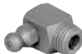
850.352 = GRAXEIRA CURVA 3/8 (ÂNGULO 90°)